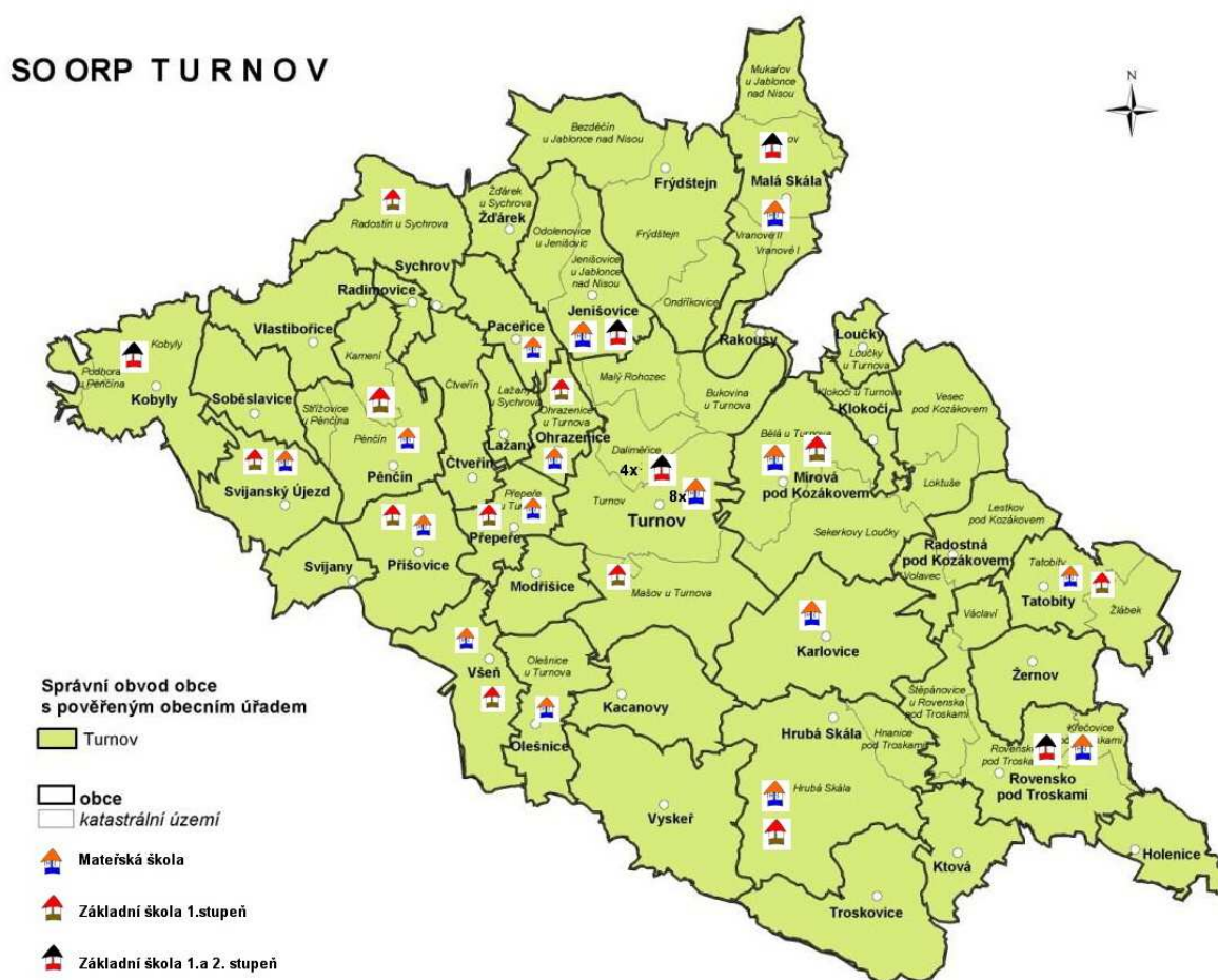
Mapa č. 1: Administrativní členění správního obvodu – k 1. 9. 2016

Správní obvod obce s rozšířenou působností (dále jen SO ORP) Turnov se rozkládá na jihu Libereckého kraje na území okresů Jablonec nad Nisou, Liberec a Semily. Sousedí v Libereckém kraji s SO ORP Jablonec nad Nisou, SO ORP Liberec, SO ORP Semily a SO ORP Železný Brod, ve Středočeském kraji s SO ORP Mnichovo Hradiště a v Královéhradeckém kraji s SO ORP Jičín. SO ORP Turnov tvoří 37 obcí. Přirozeným centrem je Turnov, který jako jediný vykonává i agendu obce s pověřeným obecním úřadem. Ostatní jsou obce 1. typu. Statut města má i Rovensko pod Troskami. SO ORP má rozlohu 247 km 2 a zaujímá 7,8 % území Libereckého kraje.