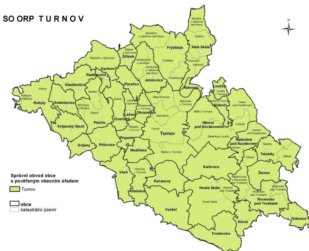
Mapa č. 1: Administrativní členění správního obvodu

Správní obvod obce s rozšířenou působností (dále jen SO ORP) Turnov se rozkládá na jihu Libereckého kraje na území okresů Jablonec nad Nisou, Liberec a Semily. Sousedí v Libereckém kraji s SO ORP Jablonec nad Nisou, SO ORP Liberec, SO ORP Semily a SO ORP Železný Brod, ve Středočeském kraji s SO ORP Mnichovo Hradiště a v Královéhradeckém kraji s SO ORP Jičín. SO ORP Turnov tvoří 37 obcí. Přirozeným centrem je Turnov, který jako jediný vykonává i agendu obce s pověřeným obecním úřadem. Ostatní jsou obce 1. typu. Statut města má i Rovensko pod Troskami. SO ORP má rozlohu 247 km 2 a zaujímá 7,8 % území kraje.